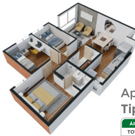
Apto Tipo B