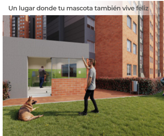
Un lugar donde tu mascota también vive feliz