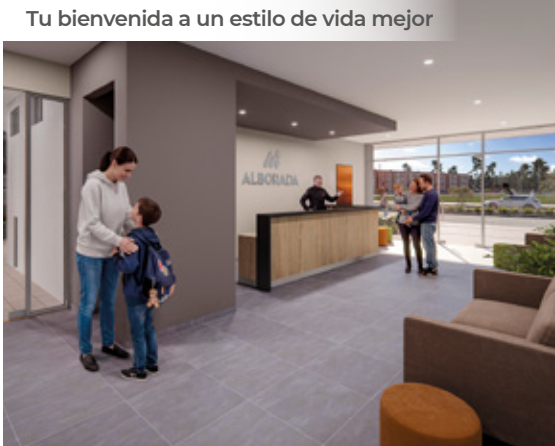
Tu bienvenida a un estilo de vida mejor