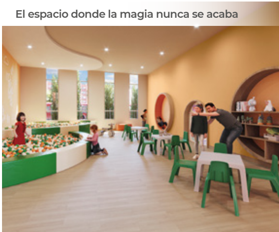
El espacio donde la magia nunca se acaba