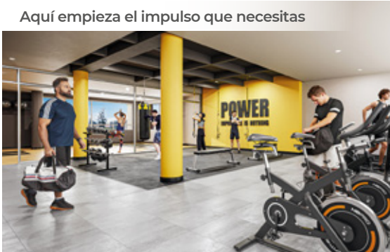
Aquí empieza el impulso que necesitas