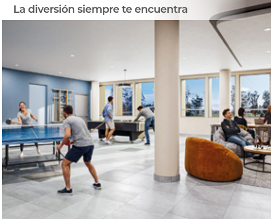
La diversión siempre te encuentra