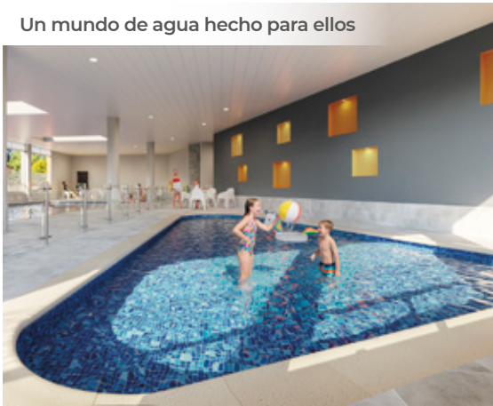
Un mundo de agua hecho para ellos