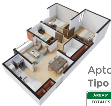
Apto Tipo A