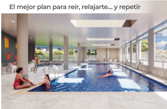
El mejor plan para reír, relajarte... y repetir