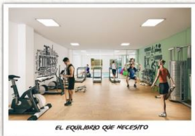
EL EQUILIBRIO QUE NECESITO