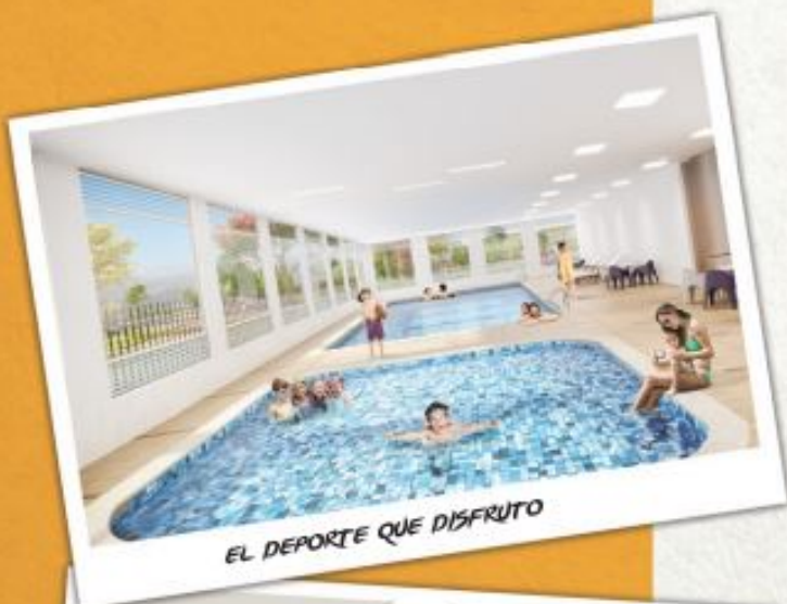
EL DEPORTE QUE DISFRUTO