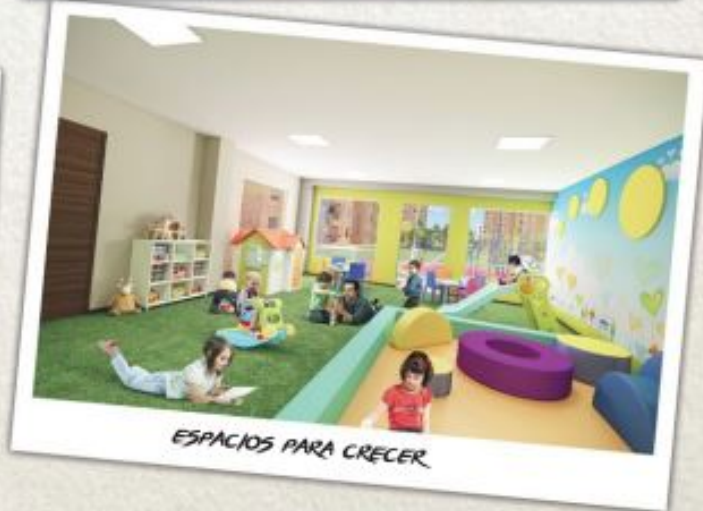
ESPACIOS PARA CRECER