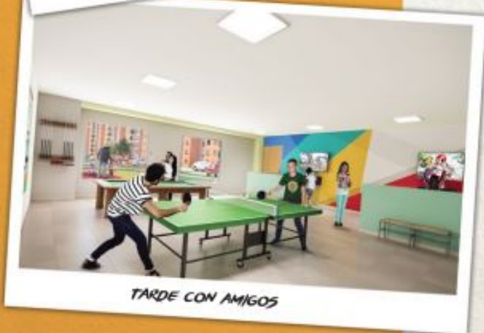
TARDE CON AMIGOS