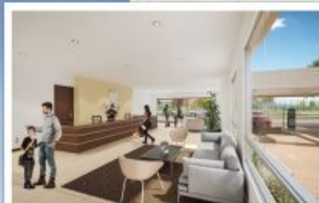
DONDE ERES BIENVENIDO